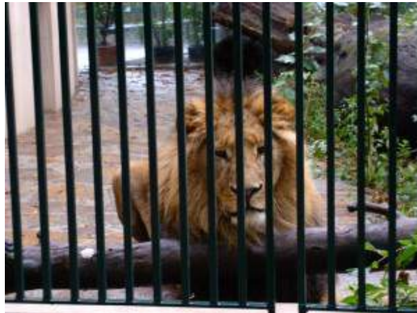
Löwen-Fotos: Tierpark Schönbrunn, Wien – 2007

Mit seinem Tod ist noch einmal die Geschichte der Menschheit nach dem Verlust der Löwenkraft sichtbar geworden. In ein Ghetto gesperrt und ständig ihrer wahren Lebenskraft beraubt, wurden die Menschen blind. Unter billigen Vorwänden konnte man sie deshalb überall hinlocken, um ihr schliesslich den Todesstoss zu versetzen und sie als Trophäe dann über die falschen Throne zu hängen.