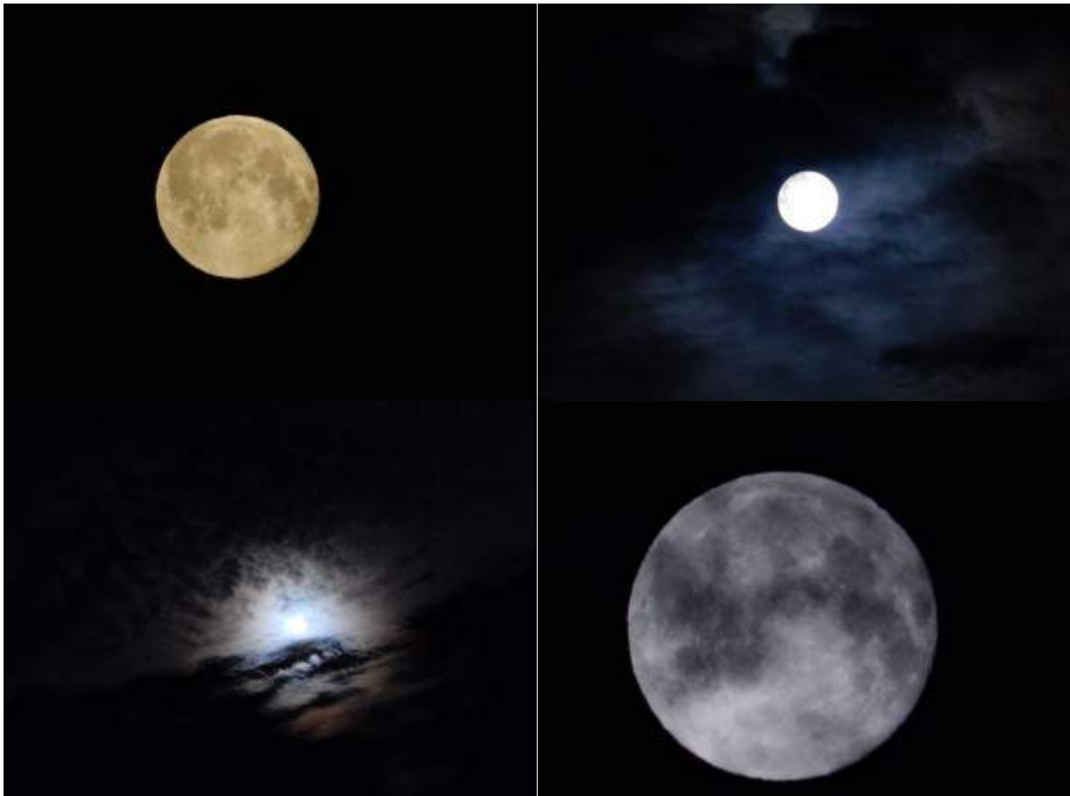
Dieser Vollmond war ein sogenannter "Blue Moon" – ein blauer Mond – der zweite Vollmond in diesem Monat