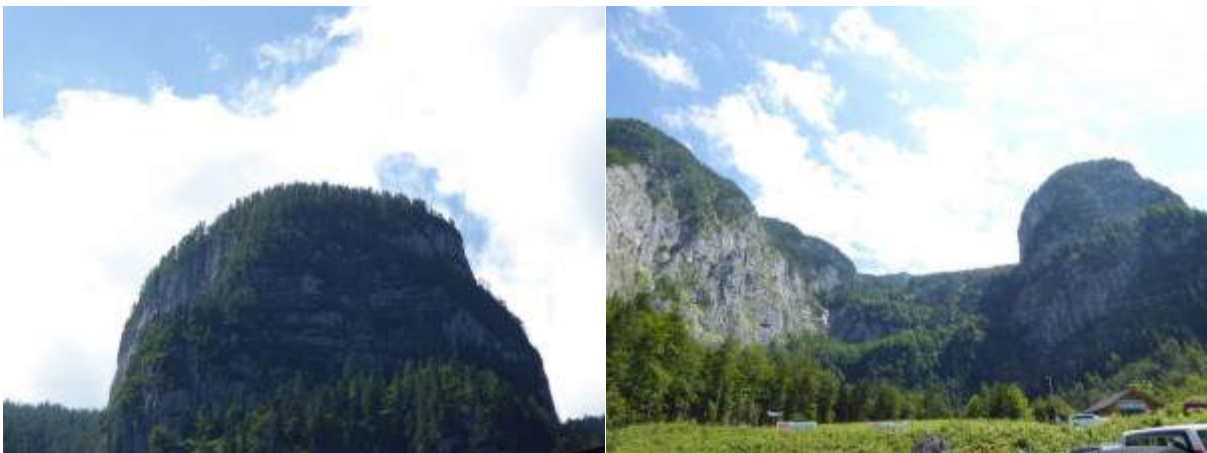
Der Hügel, durch den es in die Mammuthöhlen geht...

Die Geschichte, die sich dann entfaltete, führte Jahrtausende zurück in die Zeit, als es da noch ein anderes Reich gab... über dem jetzt jedoch dichte Nebel liegen. In den Mythen aller Völker aber klingt immer wieder davon etwas an, wenn man sie zu lesen versteht.